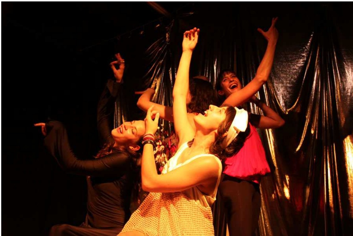
Actuaciones corales en el cuadro de la tele