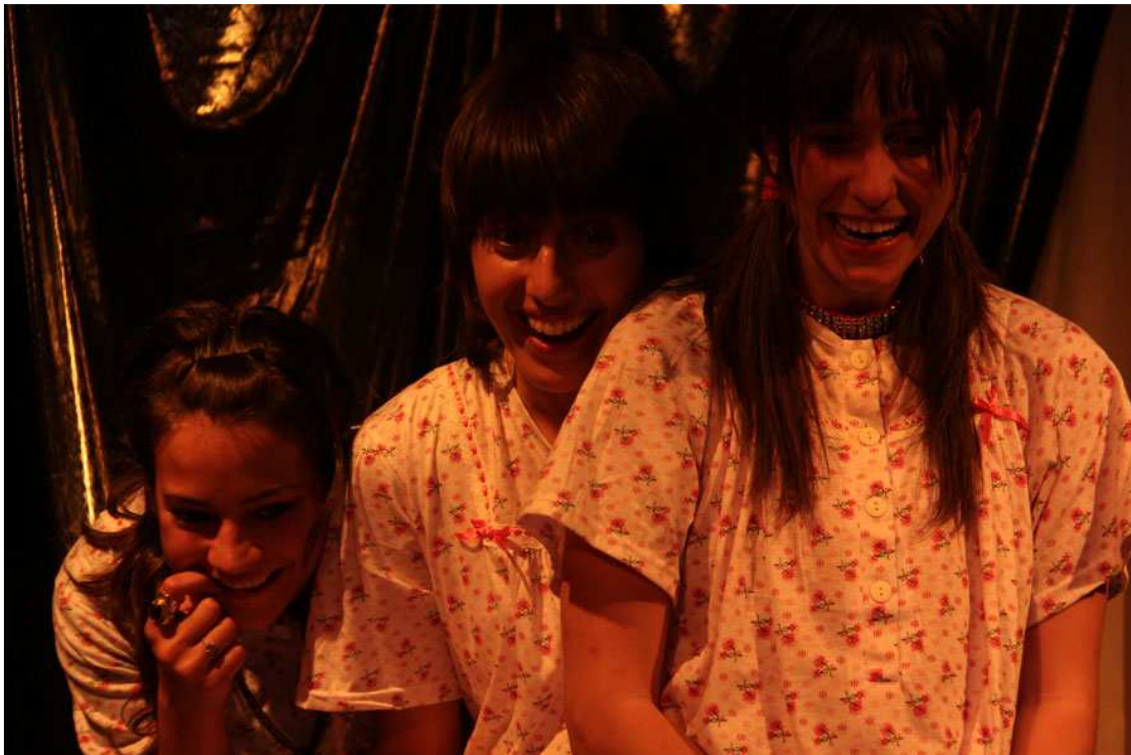
Familia media española: el padre, la madre, y las niñas...